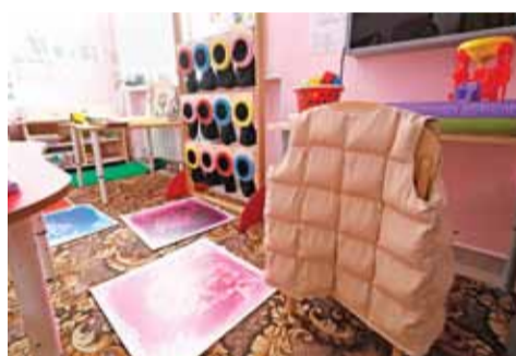
Особое внимание в Верхопенском «Родничке» также уделяют созданию доступной среды для ребят с ОВЗ. В детском саду закупили специальное оборудование для работы с детьми с РАС, нарушениями речи, зрения, задержкой психического развития. На сегодня оно как нельзя кстати актуально: из 72 детей — воспитанников детсада 14 ребят с ОВЗ

вательной программе, в то время когда ему нужна отдельная или адаптивная. Но не все родители готовы принять, что у их чада есть отклонения в развитии.