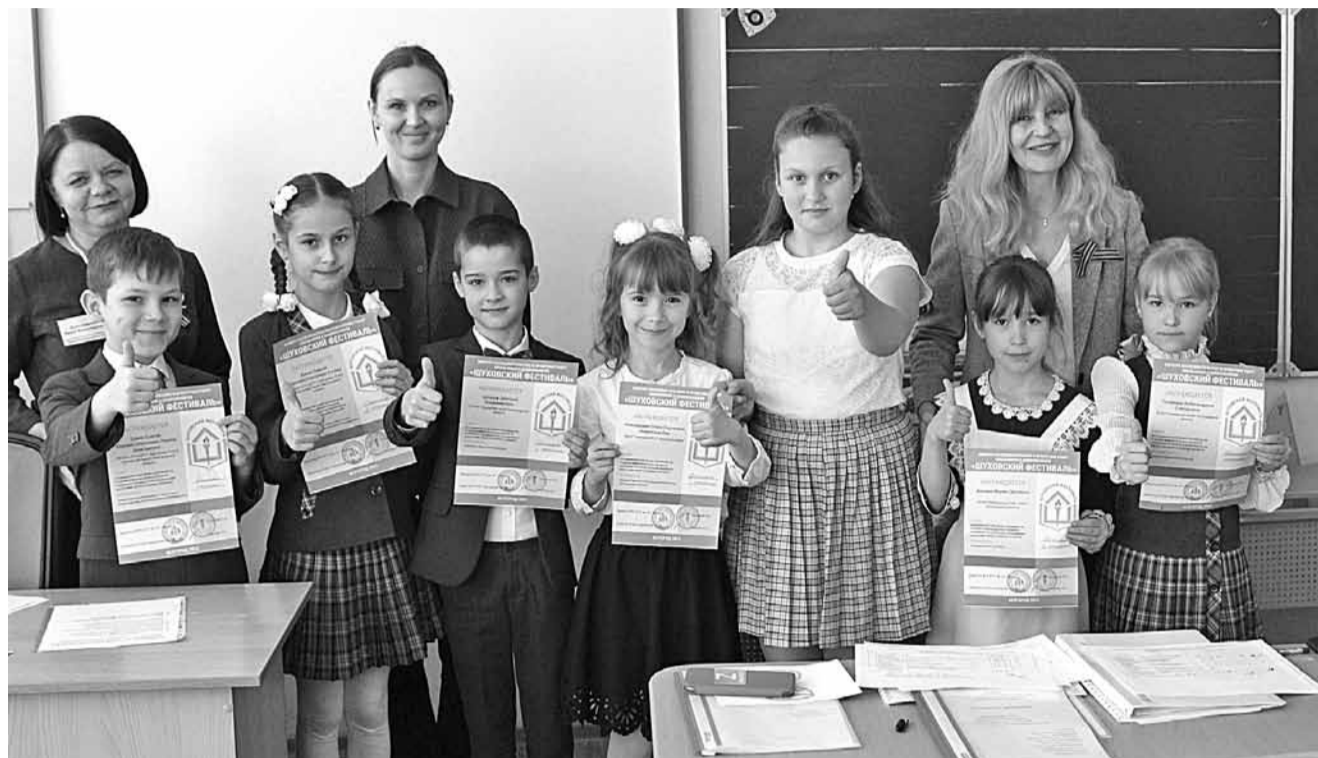
Шуховский фестиваль в Шуховском лицее

В-пятых , если посмотреть устав Российской академии наук, то он к целям её деятельности относит содействие развитию науки в Российской Федерации, распространение научных знаний и повышение престижа науки, укрепление связей между наукой и образованием, а одной из основных задач определена популяризация и пропаганда науки, научных знаний, достижений науки и техники. Школы РАН как нельзя лучше позволяют реализовать данную возможность.