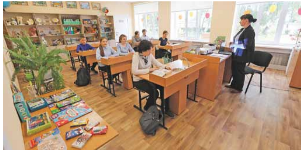
На уроке биологии

В числе семи образовательных учреждений Ивнянского района, что распахнули в последние три года свои двери после капитального ремонта, оказалась и Сафоновская школа. Некогда тусклое (как заслуженно окрестили его школьники) здание 1971 года постройки обновили в 2020 году. В 2021-м школьная территория пополнилась ещё одной постройкой — детским садом на 40 детей (сейчас структурное подразделение школы посещают 32 дошкольника).