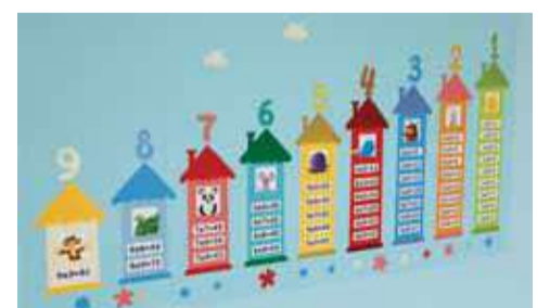
И даже стены школы теперь обучающие

Может, потому у инициативного руководителя нет острой нехватки педагогов. Четыре года назад в Сафоновскую школу приехала из Волоконовки учитель начальных классов, в прошлом — учитель истории и обществознания. Выпускник историко-филологического факультета Белгородского госуниверситета променял собственную квартиру в Белгороде и работу в городской школе (его педагог в ней — два года) на съёмное жильё в селе и девятилетку. По вторникам после уроков молодой специалист, к слову, ведёт кружок по настольному теннису.