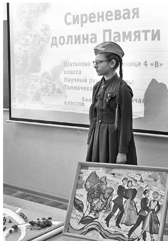
Шуховский фестиваль в Шуховском лицее

Всё пространство школы с учётом наличия технически насыщенных предметных учебных кабинетов и лабораторий, поточковых аудиторий, позволяющих большему числу учащихся общение с лучшими педагогами, трансформируемых многофункциональных залов, IT-полигонов, активно задействованных холлов, рекреаций, атриумов должно быть максимально вовлечено в образовательный процесс. В 8 — 11-х классах однозначно должны работать наиболее высококвалифицированные, специально