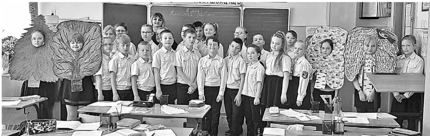
2 «Б» класс — победитель школьного конкурса «Театральные сезоны»