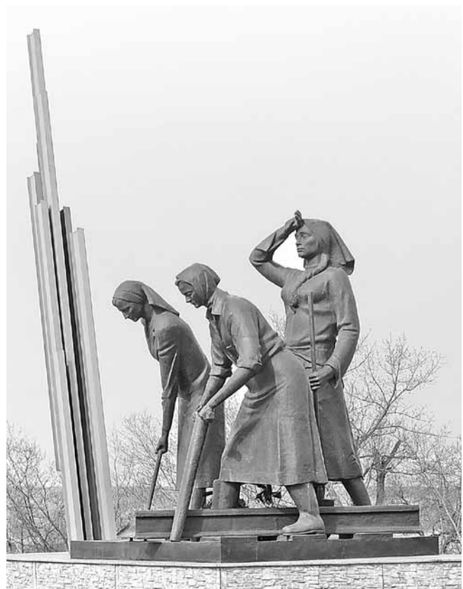
Памятник строителям железной дороги Старый Оскол — Ржава