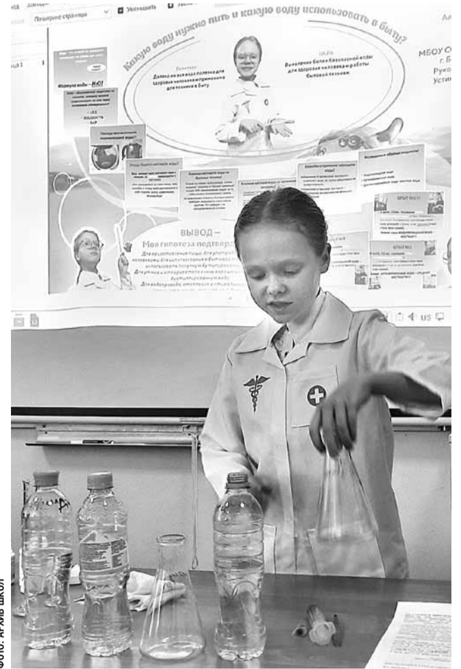
Шуховский фестиваль в Шуховском лицее

уже применяли исследовательскую деятельность, благодаря чему они во многом и оказались представленными в федеральных рейтингах. Наша задача — придать этой работе дополнительный импульс с тем, чтобы школьники становились соавторами и авторами научных статей.