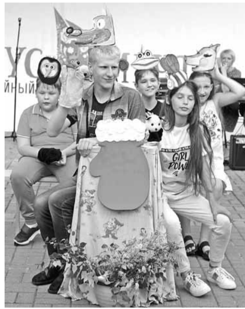
Участники инклюзивного спектакля