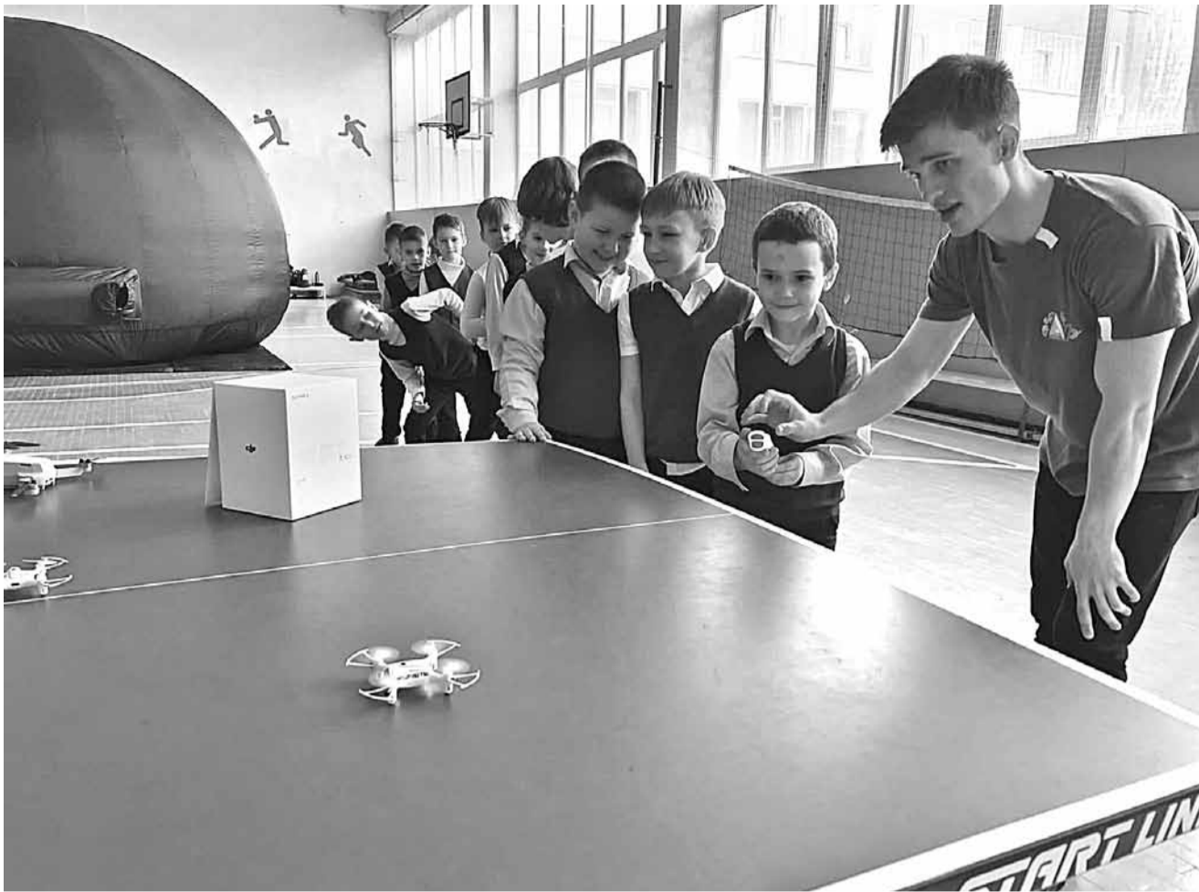
Гагаринский урок для младшеклассников школы № 20 Старого Оскола