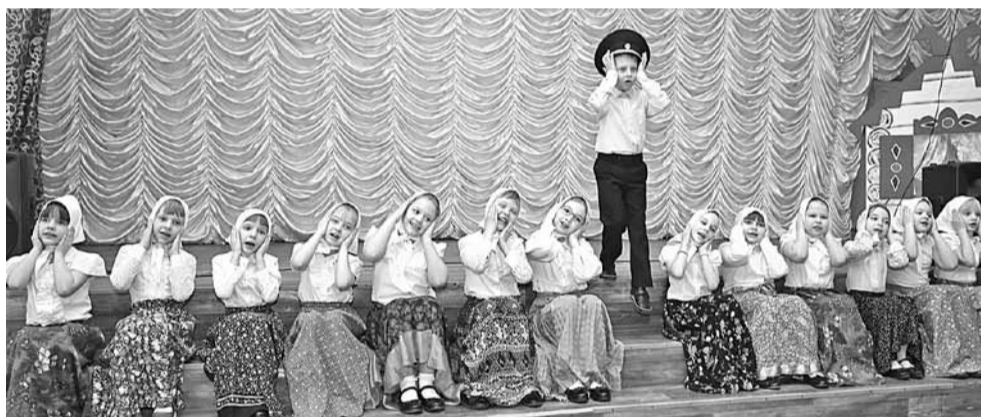
Юные артисты из начальной школы