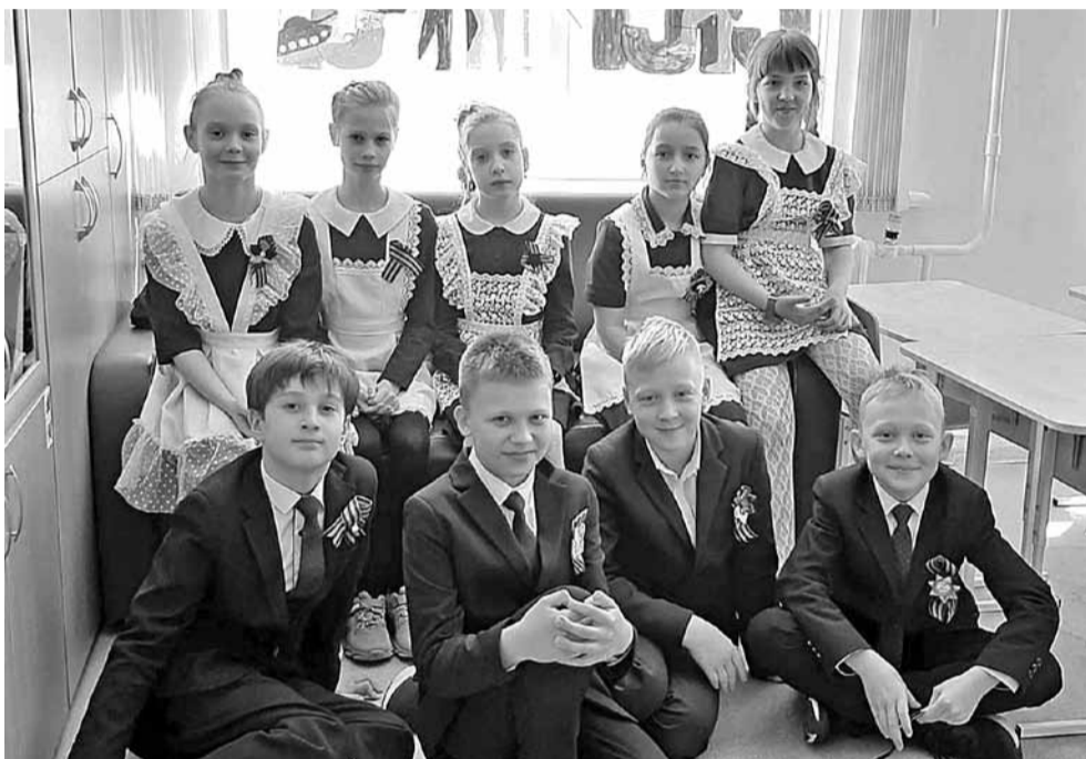
Театр 3 «А» класса «Добрые ладошки»