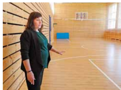
В новом спортзале — деревянные стены

По её мнению, главное — увлечь и замотивировать детей. К примеру, как это было на Всероссий-