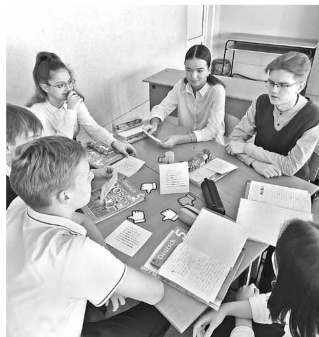
Открытый урок по иностранному языку в школе № 20 Старого Оскола

В-четвёртых , в 2018 году впервые в России наука была объявлена национальным проектом, целями которого обозначены обеспечение присутствия Российской Федерации в числе пяти ведущих стран мира, осуществляющих научные исследования и разработки в областях, определяемых приоритетами научно-технологического развития. А также обеспечение привлекательности работы в Российской Федерации для российских и зарубежных ведущих учёных и молодых перспективных исследователей. С учётом этого создание школ РАН и научно-образовательных центров (НОЦ) вполне закономерно.