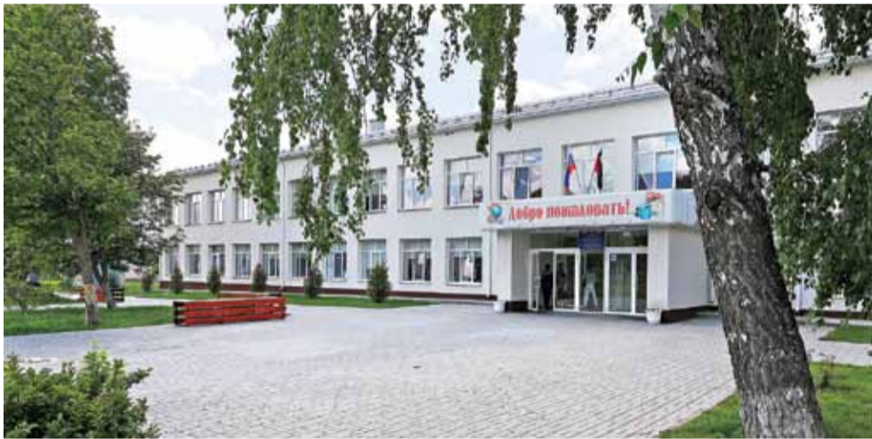
Сафоновская школа после капремонта

КАК ПОСЛЕ КАПИТАЛЬНОГО РЕМОНТА ПРЕОБРАЗИЛАСЬ САФОНОВСКАЯ ШКОЛА