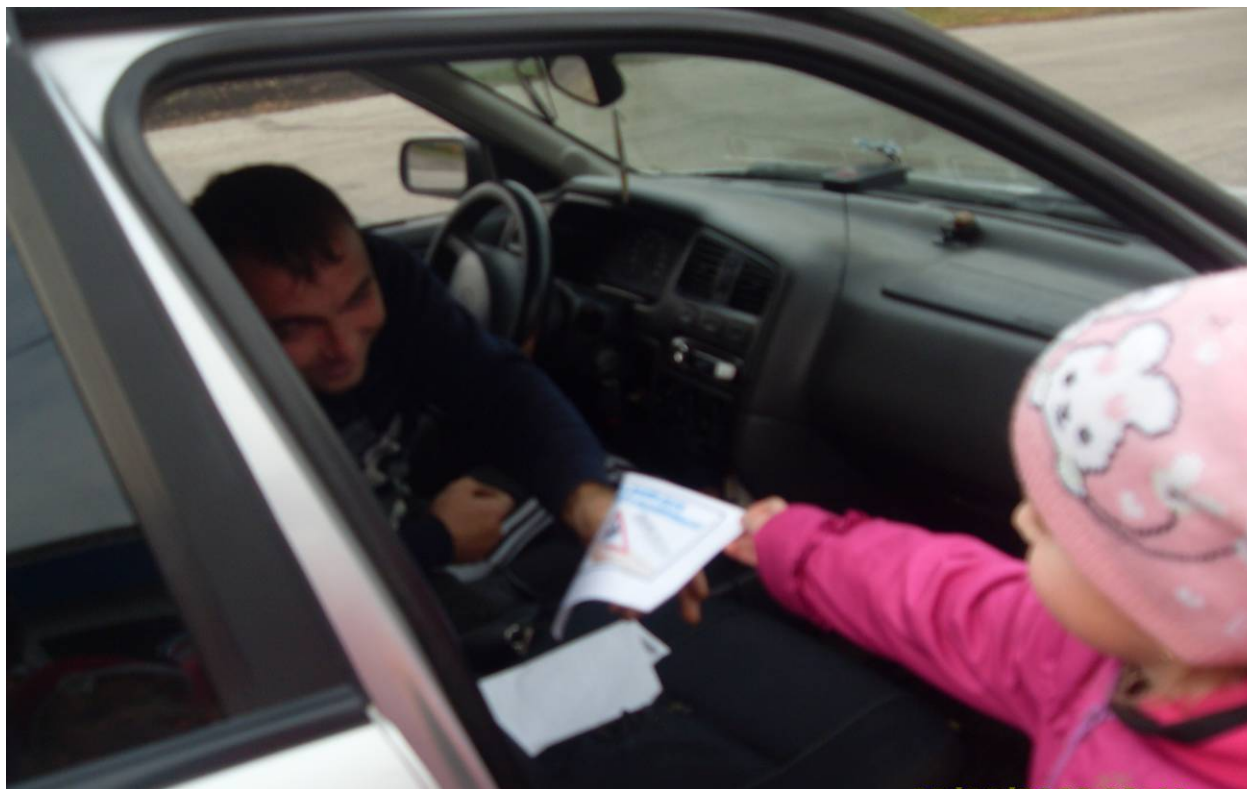
Раздача памяток родителям-водителям